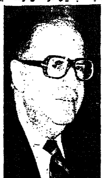
معلومات عن ابا ايلان